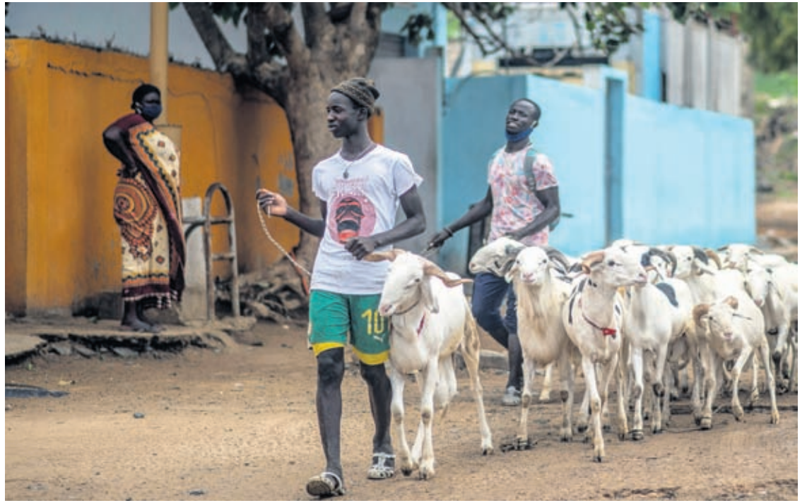
Livestock sellers bring their sheep to be washed on the beach before they are offered for sale for the upcoming Islamic holiday of Eid al-Adha, on the beach in Dakar, Senegal Thursday, July 30, 2020.

The expansion of water-hungry crops has meant that Mexico has used 71% of the northward-flowing Conchos River, while under the treaty it should use only 62% of the water, letting the rest of it flow into the Rio Bravo, also known as the Rio Grande, on the border. In the past, Mexico has delayed payments, hoping that periodic tropical storms from the Gulf would create occasional windfalls of water. But while Hanna made landfall in Texas earlier this month, the storm's rains did not reach far enough inland to fill dams in Chihuahua. □